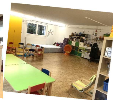
Raum Zopf matt